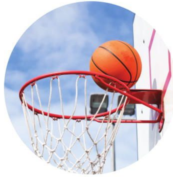
बास्केटबाल लॉन टेनिस कोर्ट